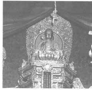
▶本尊 釈迦牟尼佛座像